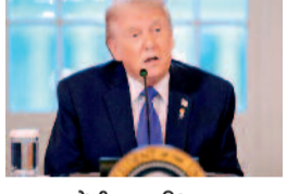
>>> वाशिंगटन

ग्रीनलैंड पर कब्जा करने की योजना पर डोनाल्ड ट्रंप का विरोध करने वाले 8 देशों पर अमेरिका ने 10 फीसदी अतिरिक्त टैरिफ लगाने का ऐलान कर दिया है। डोनाल्ड ट्रंप ने बताया कि डेनमार्क, नॉर्वे, स्वीडन, फ्रांस, जर्मनी, यूके, नीदरलैंड्स और फिनलैंड पर 10 फीसदी का अतिरिक्त टैरिफ लगाया जाएगा। अगर ग्रीनलैंड की खरीद वाली डील नहीं पूरी हो पाती है तो इस टैरिफ को बढ़ाकर 25 फीसदी कर दिया जाएगा। ट्रंप की धमकियों के बीच कांग्रेस के एक द्विदलीय प्रतिनिधिमंडल ने डेनमार्क और ग्रीनलैंड को अपने समर्थन का आश्वासन देने की कोशिश की।