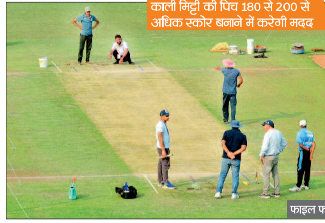
काली मिट्टी की पिच 180 से 200 से अधिक स्कोर बनाने में करेगी मदद

छत्तीसगढ़ की काली मिट्टी के पिच में इस बार जो पहले बल्लेबाजी करने उतरेगा उसे फायदा होगा। एक्सपर्ट का कहना है कि काली मिट्टी में गेंद पिच पर फंसती नहीं है और सीधे बल्ले पर आती है, बल्लेबाजों को शॉट खेलने में बहुत आसानी होती है। गेंद की गति का इस्तेमाल करते हुए खिलाड़ी बड़े शॉट आसानी से लगा सकते हैं। रायपुर का मैदान बड़ा है, लेकिन पिच की रफ्तार बड़े स्कोर 180 से 200 से अधिक बनाने में मदद करेगी। अगर ओस अधिक पड़ी तो दूसरी इनिंग में बल्लेबाजों को समस्या हो सकती है।